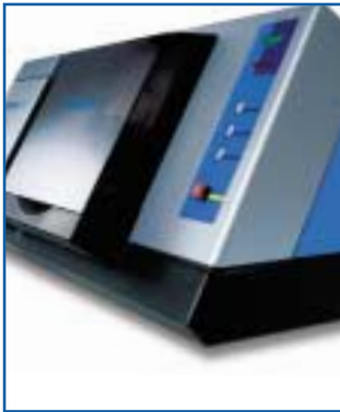
SCAN- UND FRÄSEINHEIT

Erst durch die Weiterentwicklung einer Forschungsarbeit der renommierten Eidgenössischen Technischen Hochschule Zürich ist es möglich, diesen Werkstoff wirtschaftlich in der Dental-Technik einzusetzen.